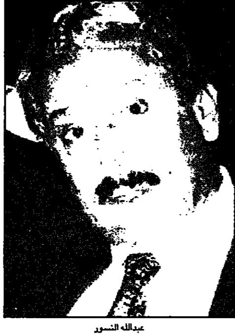
عزام - القدس العربي

يشهد مجلس الوزراء الأردني تصدعاً من الداخل خلال اليومين الماضيين في إطار تفاعلات قضية ثلوث المياه التي شغلت الرأي العام.